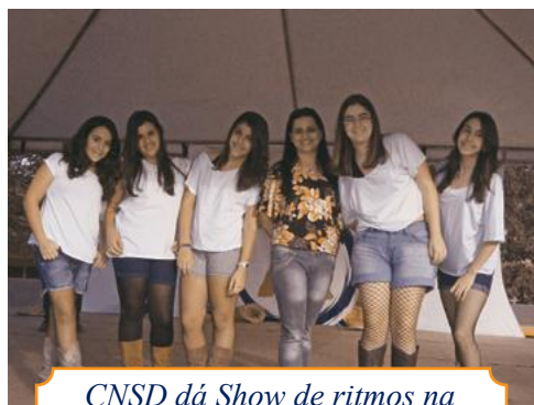
CNSD dá Show de ritmos na UNIUBE Aberta