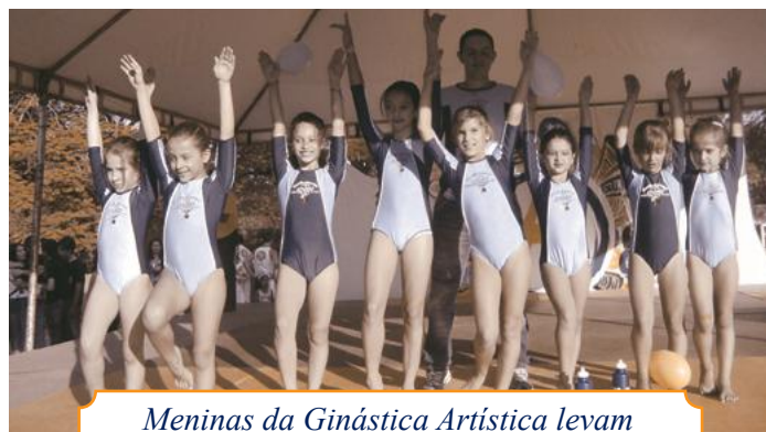
Meninas da Ginástica Artística levam encantamento à UNIUBE Aberta