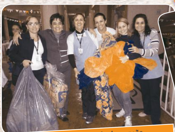
Turma animada da decoração