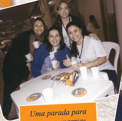
Uma parada para repor as energias