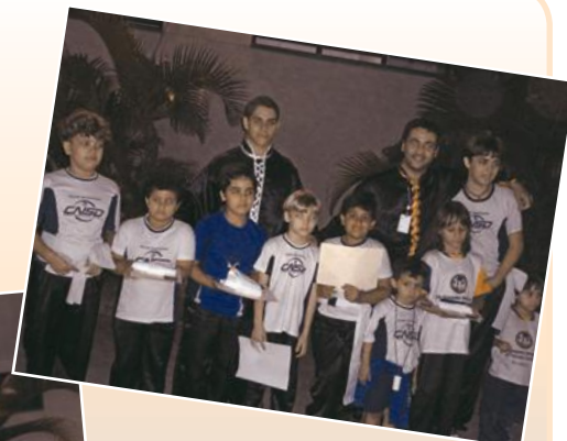
Alunos da escola de esportes CNSD graduem em Kung Fu e trocam de faixa