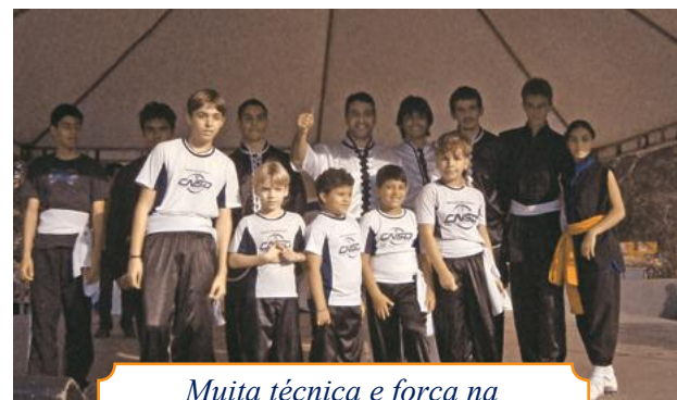
Muita técnica e força na apresentação de Kung Fu