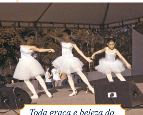
Toda graça e beleza do Ballet do CNSD