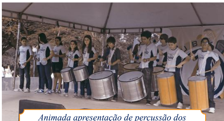
Animada apresentação de percussão dos alunos do Fundamental II