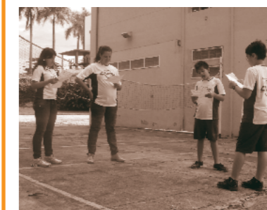
Ensaio de peça teatral - Projeto Teia Literária