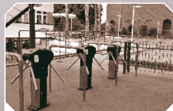
Catracas eletrônicas com chip de identificação