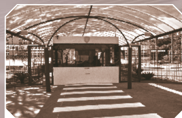
Portaria 24h com drive thru para embarque e desembarque