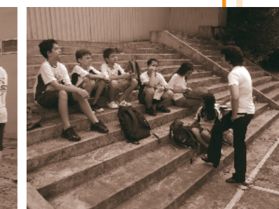
Aula direcionada de Matemática