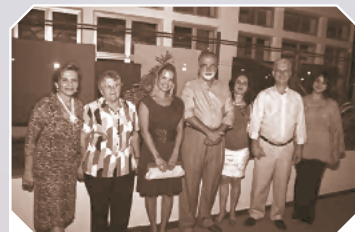
Prefeito participa da inauguração da nova recepção