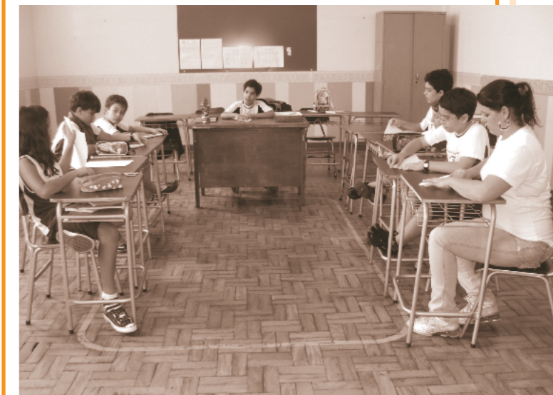
Aluno dando aula de dobradura - Projeto Revelando o Período Integral

O sucesso da aprendizagem depende de ações direcionadas e específicas, de acordo com as necessidades educacionais dos alunos. Desse modo, o Período Integral apresenta, em 2010, sua nova proposta didática, com inovações pedagógicas, as quais estão sendo realizadas de maneira prazerosa, facilitando a aprendizagem de nossos estudantes.