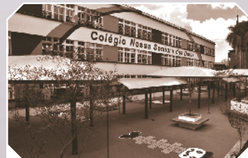
Pátio escolar lúdico