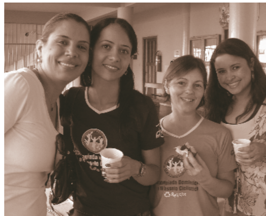
Professores e funcionários presentes no 3º Retiro