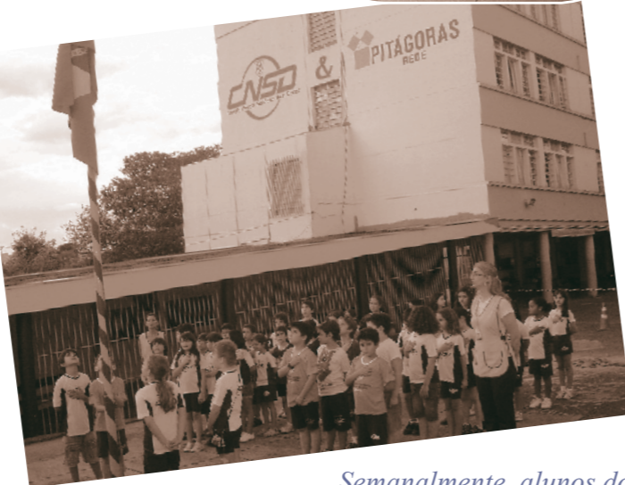
Semanalmente, alunos do CNSD se organizam para o hasteamento da bandeira ao som do Hino Nacional.