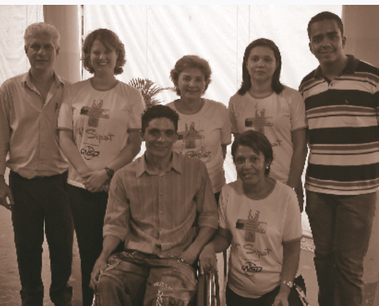
SIPAT realizada no período de 19 a 23 de outubro de 2009

Assegurar um local de trabalho livre de riscos e de condições ambientais que possam provocar danos à saúde física e psicológica das pessoas, deve ser objetivo de todas as empresas. A Comissão Interna de Prevenção de Acidentes (CIPA) gestão 2009/2010 considera os mesmos, sua meta.